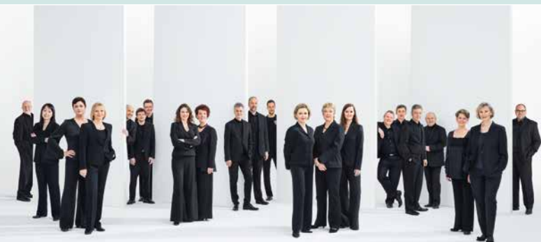
SWR Vokalensemble Stuttgart