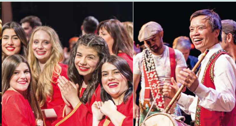
Heimatlieder aus Deutschland

Das Projekt „Heimatlieder aus Deutschland“ versammelt mittlerweile über 120 Musiker aus rund 15 Nationen, die die Lieder vorstellen, die sie beziehungsweise ihre Eltern aus allen Teilen der Welt mit nach Deutschland gebracht haben – von kubanischem Son über serbische Ethnomusik bis hin zu UNESCO-geschütztem Quan-Hò-Gesang aus Vietnam. Nach mehrfach ausverkauften und umjubelten Auftritten, unter anderem in der Komischen Oper Berlin, der Semperoper Dresden, im Hamburger Thalia Theater oder den Münchner Kammerspielen, werden beim Chorfest in Stuttgart auch Ensembles auf der Bühne stehen, die im Raum Stuttgart verwurzelt sind und das Projekt mit ihrer Musik neu bereichern. Ein außergewöhnliches Konzerterlebnis, das in eine Party mündet, bei der KünstlerInnen und Publikum gemeinsam singen und tanzen – wie immer bei den „Heimatliedern“!